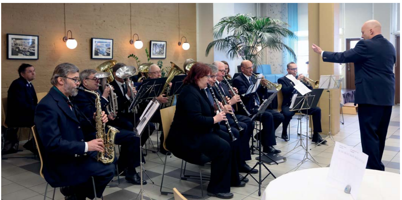
Juhlan musiikista vastasi Kiikan torvisoittokunta. Juhlassa kuultiin kappaleet: Maasalon juhلامarssi, Vartiossa, Nuijamiesten marssi ja On hetki.