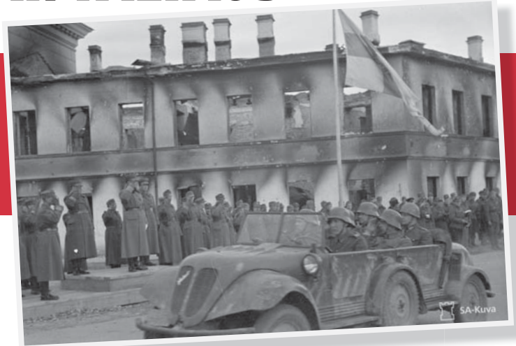
Suomalaisjoukot valtasivat Petroskoin syys-lokakuun taitteessa 1941 ja nimesivät sen heti Äänislinnaksi. Valtausparaati pidettiin 12.10.1941.

Illallinen ja yöpyminen Park Inn Petrozavodsk-hotellissa.