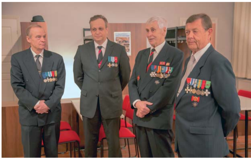
Riihimäen Seudun Tykistökillan komeat edustajat odottavat onnitteluvuoroaan museon aulatilassa.