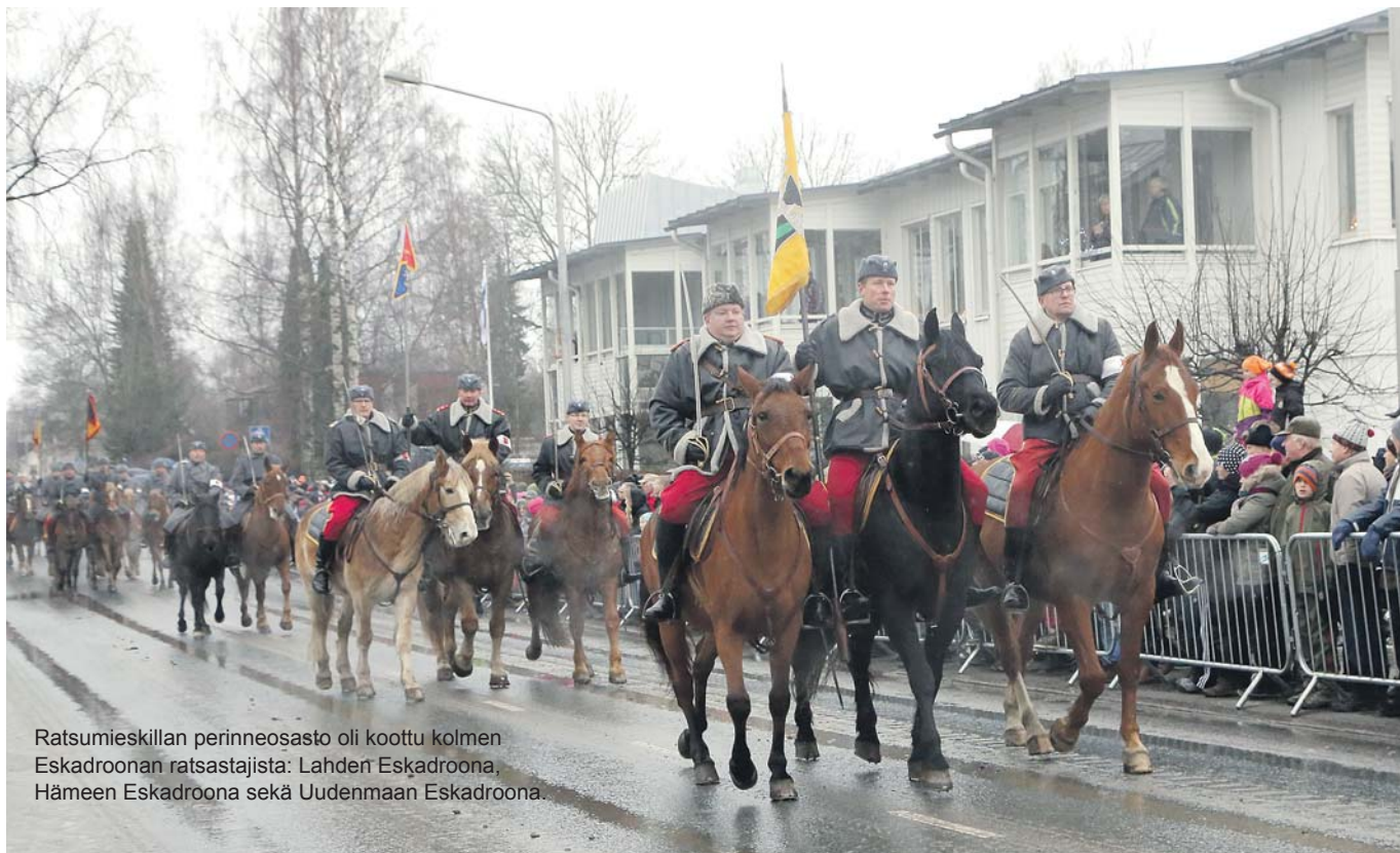
Ratsumieskillan perinneosasto oli koottu kolmen Eskadroonan ratsastajista: Lahden Eskadroona, Hämeen Eskadroona sekä Uudenmaan Eskadroona.