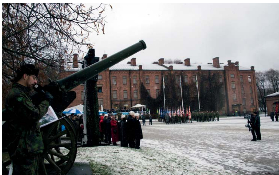
Paraatikatselmus suoritettiin Linnankasarmien kentällä.

Päivään liittyi runsaasti muutakin ohjelmaa. Kalustoesittelyjä sekä toimintanäytöksiä järjestettiin Hämeenlinnan ympäristössä. Paraatin teemana oli Puolustusvoimat: suorituskykyä maalla, merellä ja ilmassa . ■