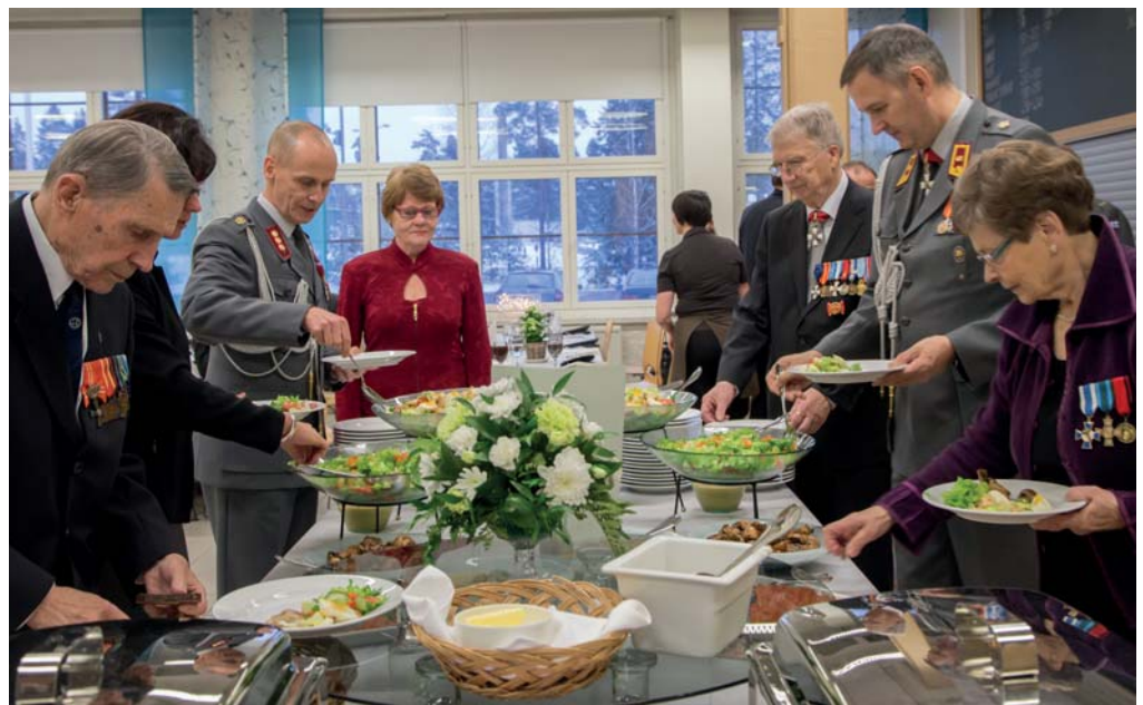
Juhlan virallisen ohjelman jälkeen päästiin nauttimaan Ravintola Patruunan maittavasta juhlapäivällisestä.