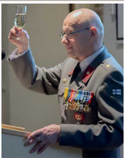
Malja kahdenkymmenen viiden vuoden ajan tykkimiesten yhdyssiteenä ja tiedotuskanavana toimineelle Tulikomentaja-lehdelle.